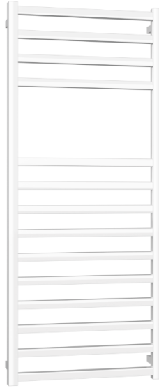
IMMAGINE PRODOTTO / PRODUCT IMAGE