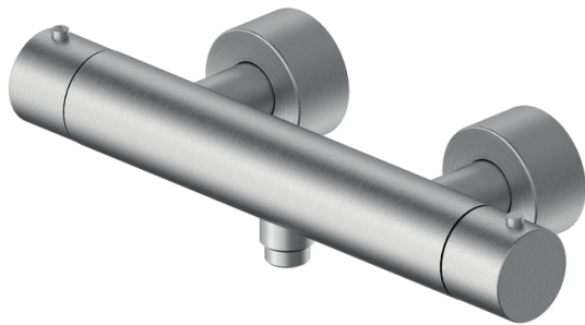
IMMAGINE PRODOTTO / PRODUCT IMAGE