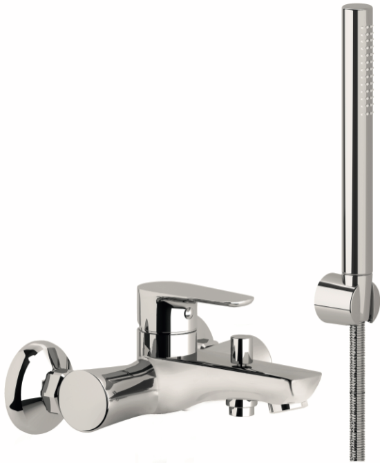
IMMAGINE PRODOTTO / PRODUCT IMAGE