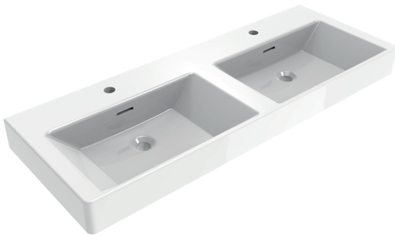
IMMAGINE PRODOTTO / PRODUCT IMAGE