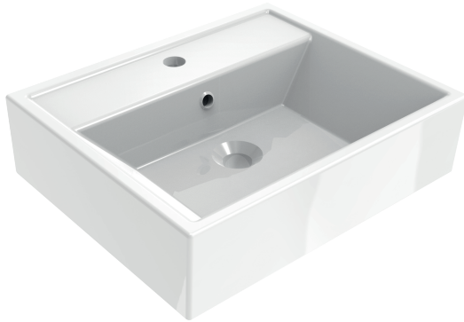
IMMAGINE PRODOTTO / PRODUCT IMAGE