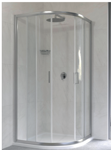
IMMAGINE PRODOTTO / PRODUCT IMAGE